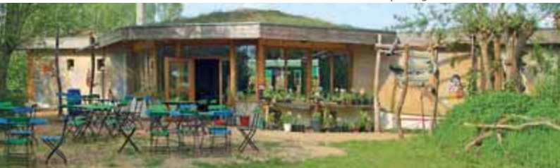
Wangelin Garden Café

Please also inform us, whether you have applied for funding, e.g. Bildungsprämie or other.